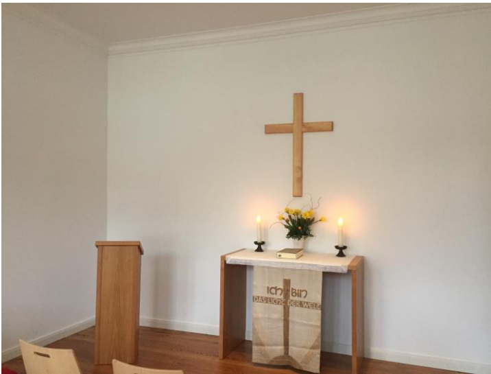
Der neue Altar im Gemeinderaum